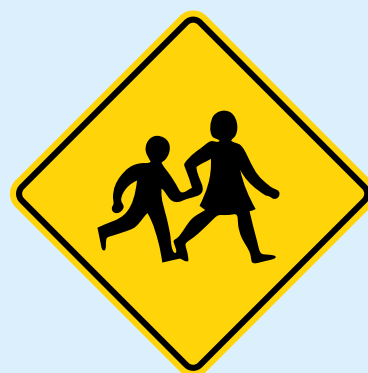
Niños en la vía