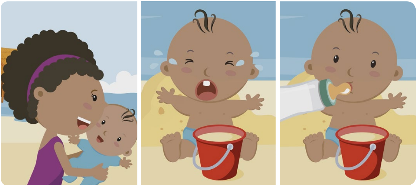
Figura 1: Bufito bebé.

Bufito nació en Baudó un municipio del departamento de Chocó en Colombia. Cuando Bufito era bebé, se comunicaba con su mamá a través de gestos. Entonces, lloraba si tenía hambre, sonreía cuando estaba feliz o fruncía el ceño al sentirse incómodo (figura 1).