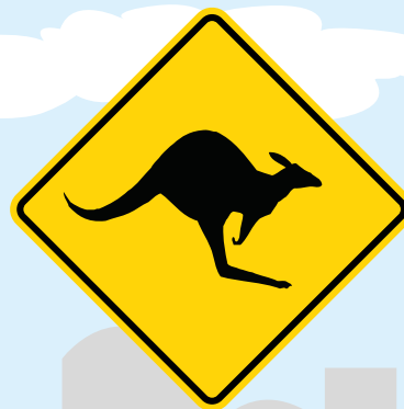
Animales en la vía