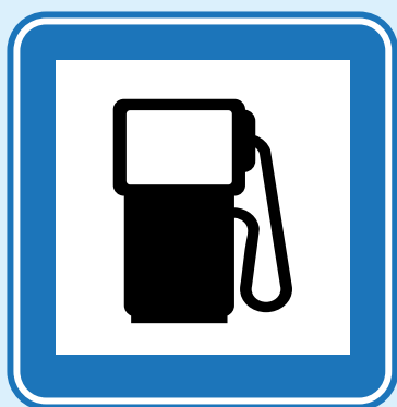
Estación de gasolina

Las señales son otra forma de lenguaje no verbal. Observa algunas de ellas.