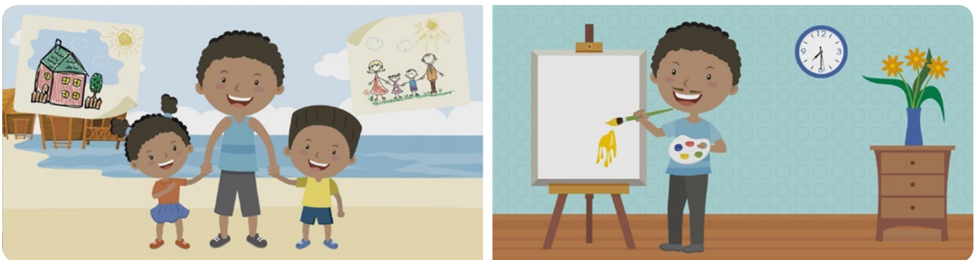
Figura 3: Bufito adulto.

A sus 17 años, Bufito quiso ayudar a su familia, así que empezó a trabajar, enseñándole a escribir y a leer a los niños de su región; para esto, al comienzo Bufito utilizaba dibujos a través de los cuales les contaba historias a los pequeños. Su primer trabajo le permitió a Bufito convertirse después en un gran dibujante (figura 3).