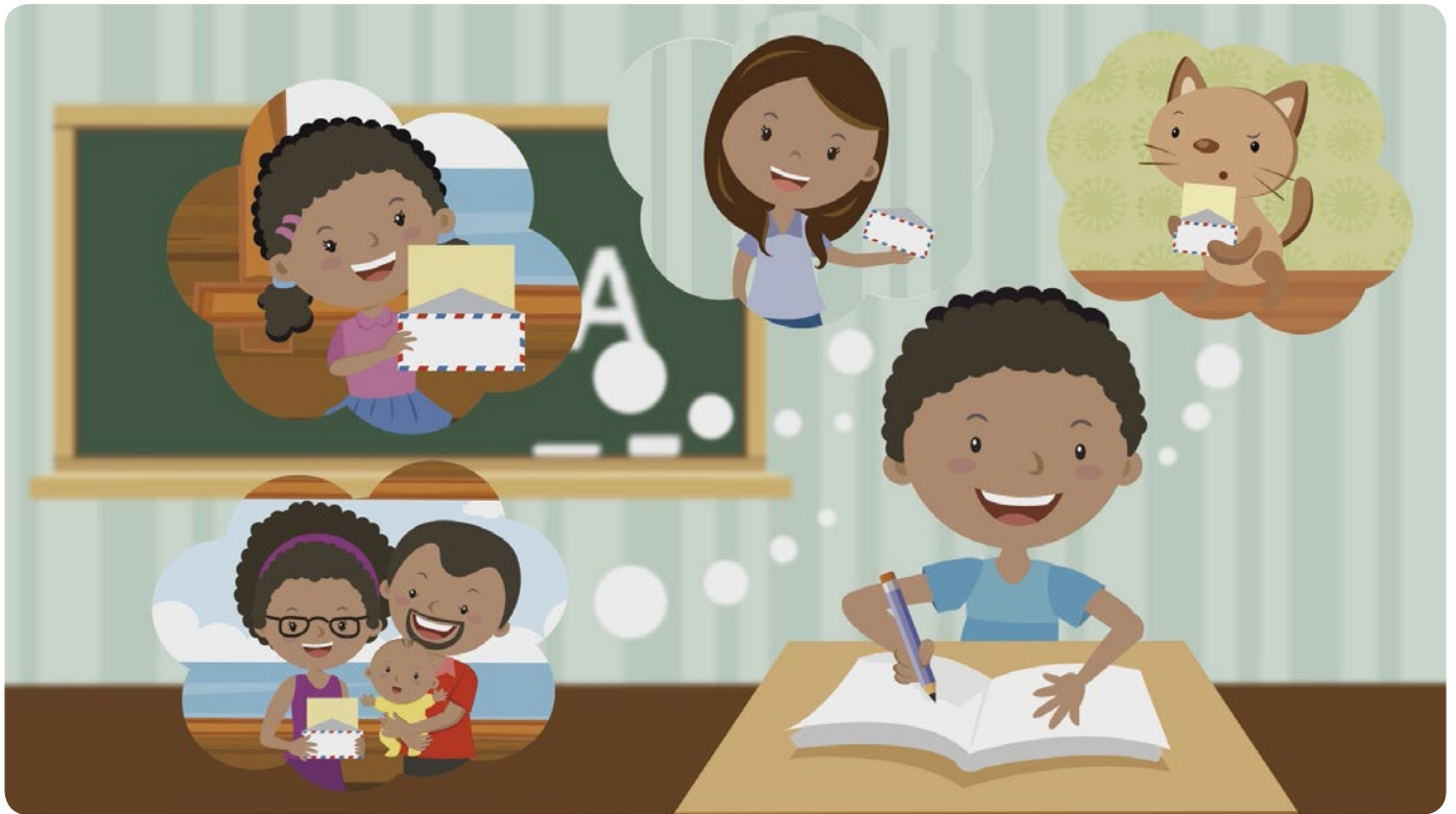
Figura 2: Bufito a los 4 años.

cartas para todos: para sus papás, sus hermanos, su profesora y para su gato, que no le entendía nada. Así Bufito desarrolló un gran talento para escribir (figura 2).