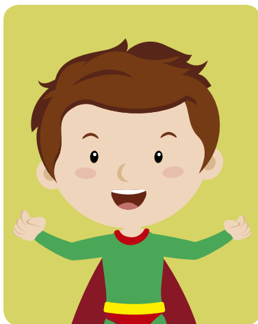
Capitán Punto y Coma